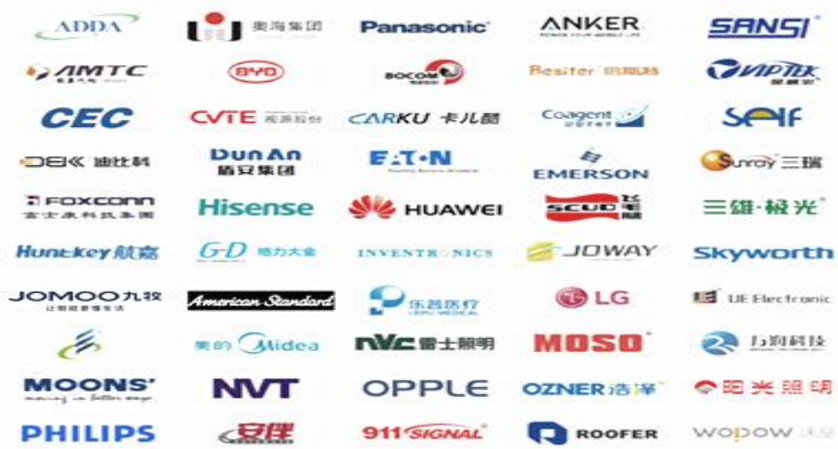
以上用户为部分用户, 排序不分先后